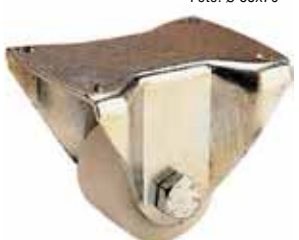
Foto: Ø 85x70