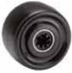
Foto: Ø 63x38